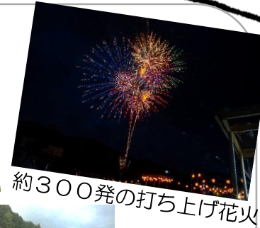
約300発の打ち上げ花火