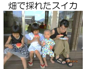
畑で採れたスイカ