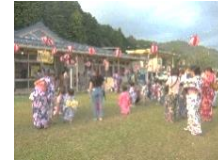
ゲームコーナーに盆踊り 楽しかったね