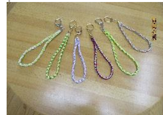
組み紐キーホルダー完成