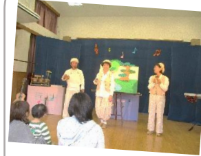
ほんわかシアターの皆さん