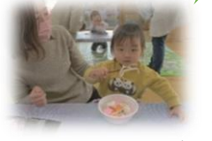
お雑煮の出来上がり