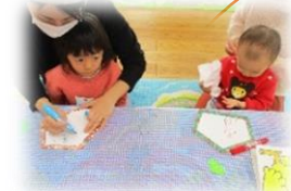
絵馬に願い事を書きました