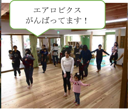
エアロビクス がんばってます！