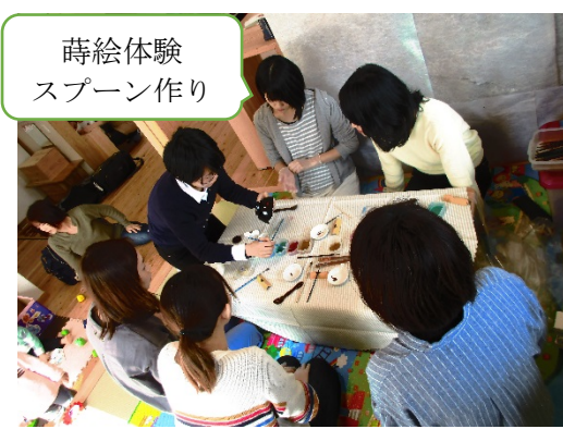
蒔絵体験 スプーン作り

園庭でみんなでかけっこをしたり、ブランコ・すべり台・三輪車・砂場などでいっぱいあそびましょう。雨天の場合は、お部屋の中であそびましょう。