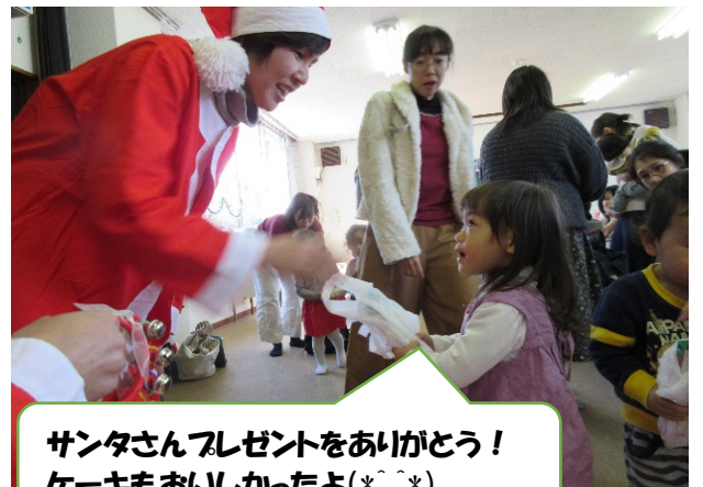
サンタさんプレゼントをありがとう！ ケーキもおいしかったよ(*_*)