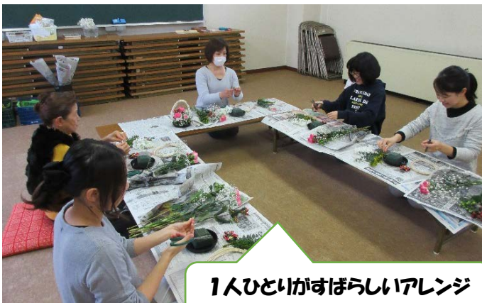
1人ひとりがすばらしいアレンジ フラワーができました！