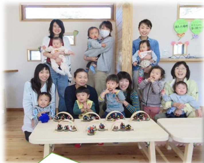
木育ひろばでクリスマスの飾りを作りました。すてきでしょ?

栗山ママのスキンシップたいむです。スキンシップのすてきと不思議を体験しましょう。今月のテーマ「なかよしスキンシップ 虹のトンネル」ママのセルフケア「早めの花粉症対策、腎臓のケア」