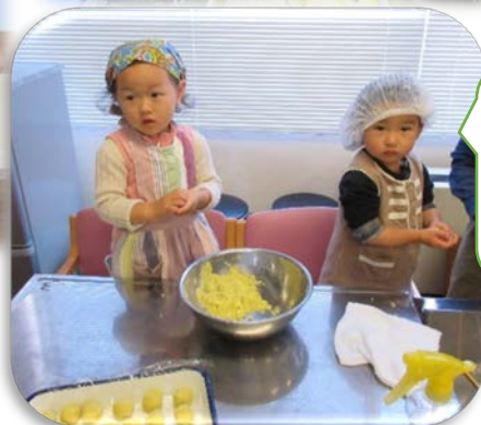
さつまいものおまんじゅうを作りました。おいしいよ!